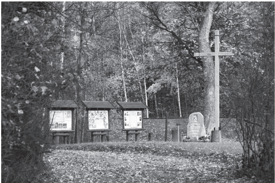
Miejsce Pamięci Leśników Polskich - ofiar Zbrodni Katyńskiej, utworzone w 2013 roku na obrzeżach rezerwatu przyrody „Cisy Staropolskie” w Wierzchlesie.